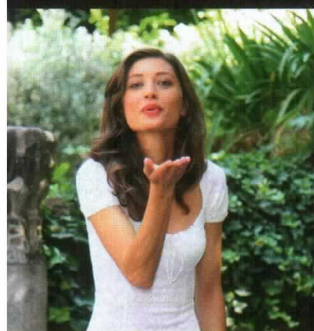
donna per la vita, 2012