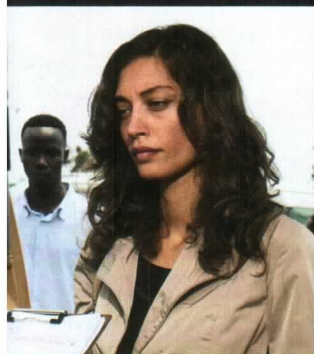
se delle piccole piogge, 2012

Margareth Madè ha esordito alla grande nel cinema: con il film di Giuseppe Tornatore, Baaria , del 2009. Un anno dopo ha superato un impegnativo confronto: nella miniserie tv La mia casa è piena di specchi aveva il ruolo di Sophia Loren. In questi giorni è nelle sale con il film di Maurizio Casagrande Una donna per la vita .